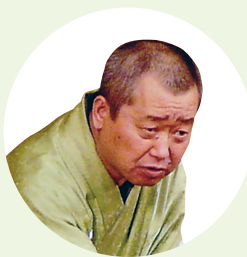
笑福亭福笑 「桃太郎」